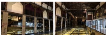
실내 1층 전시공간