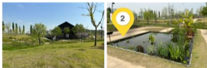
1. 진입로 잔디밭 | 2. 상부수조