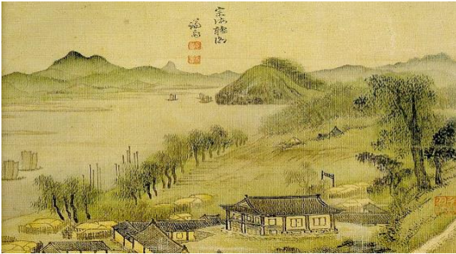
겸재 정선(1676~1759), <중해청조>(1740), 비단에 채색, 23.0×29.2 cm, 간송미술관 소장품